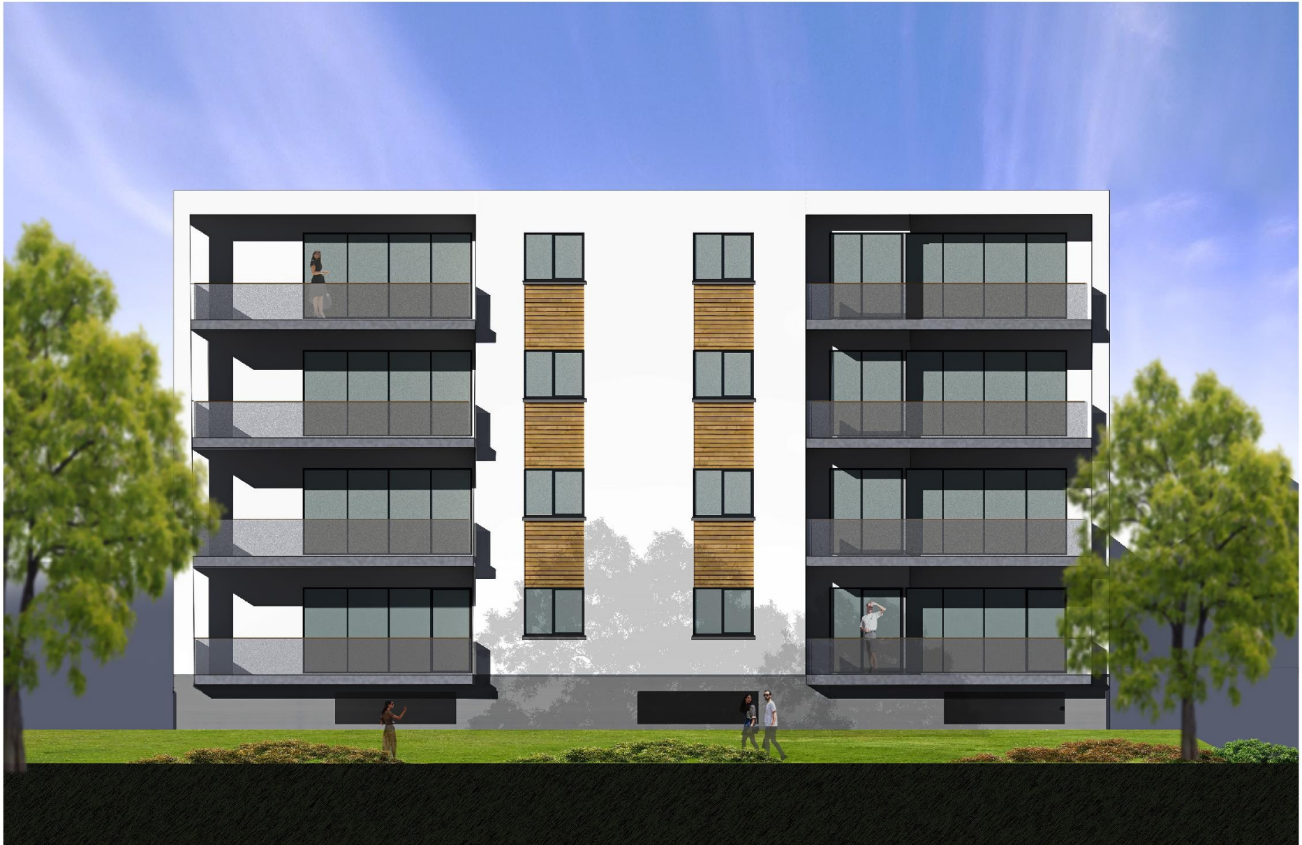
VISUALISERING AF FACADE